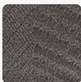
Sherman Antracit Tölgy Q1346 RO "KIFUTÓ"