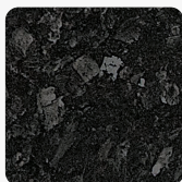
Fekete Kovakő K210 CR Felületi struktúra: Gyöngyház