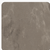
Weathered Aggregate WXA