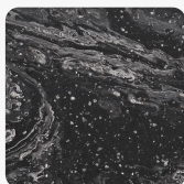
Cosmos Prima PX