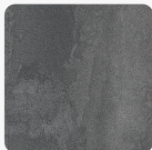
Iron Flow K352 RT Felületi struktúra: Rust