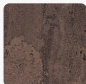
Rusty Flow K351 RT Felületi struktúra: Rust