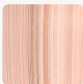
Bleached Nuwood BLW